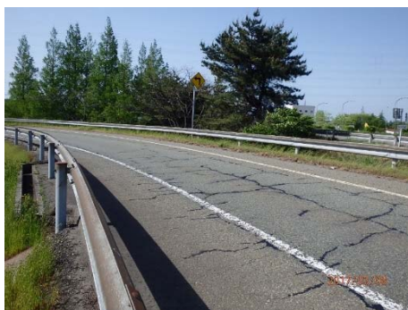
①長野方面からの入口の舗装路面状況

北陸自動車道 上越ICのランプ部(高速道路と一般道のアクセス部)において損傷した路面の補修を行います。