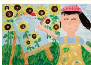
わたしの夢は絵かきさん 妙高市立妙高小学校 4年