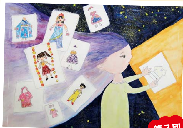
デザイナーになる！ 上越市立大瀧小学校 3年