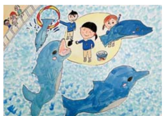
あこがれのドルフインレーナー 上越教育大学附属小学校 4年