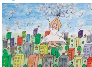
たんぽぽのわた毛にのって 上越市立上杉小学校 6年