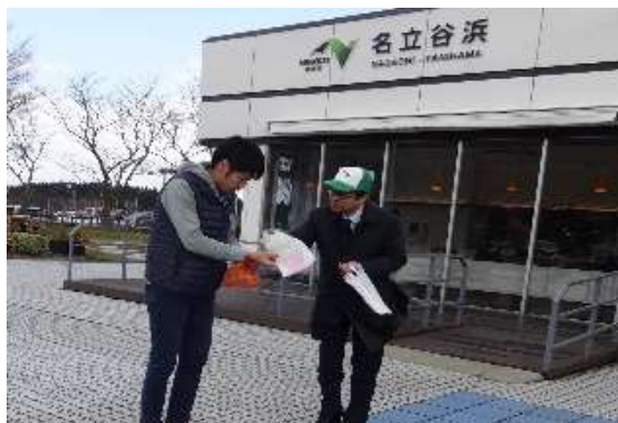
社員による安全啓発