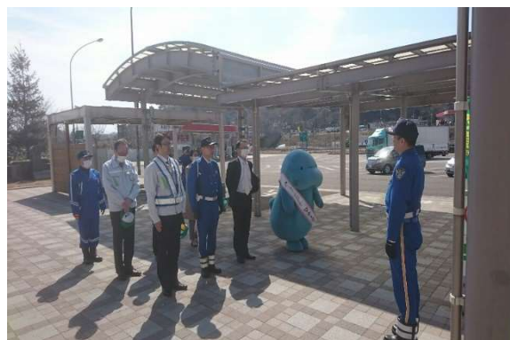
関係機関と合同で安全啓発