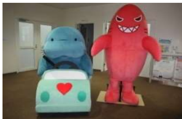
NEXCO東日本オリジナルキャラクター マナーティ(左)・イカンザメ(右)