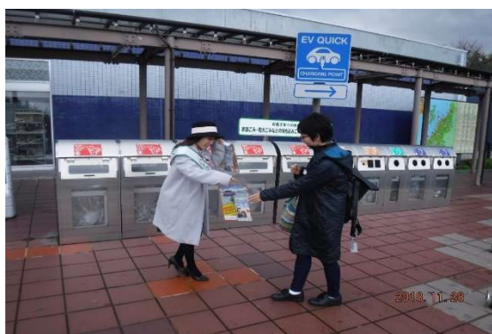
ハイウェイレディによる安全啓発