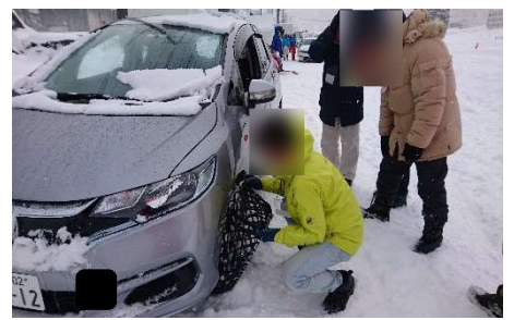
(チェーン着脱体験)