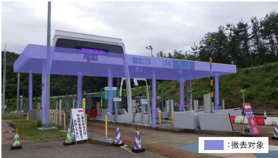
米山IC 工事対象箇所