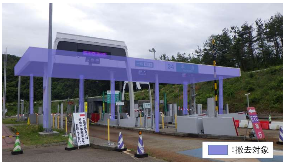
米山IC 工事対象箇所