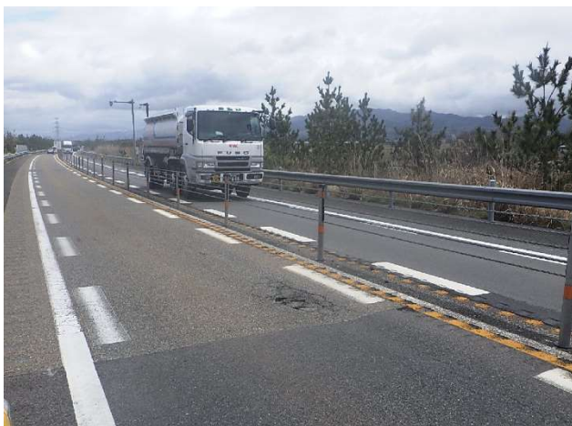
舗装路面の状況（聖籠新発田IC～荒川胎内IC）