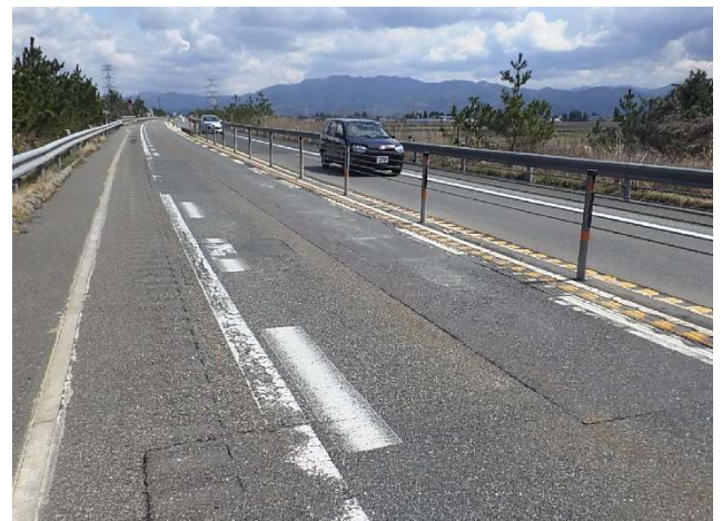
舗装路面の状況（聖籠新発田IC～荒川胎内IC）