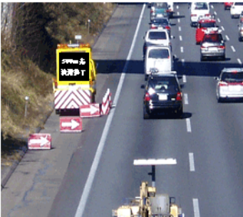
①「渋滞終了」をお知らせする表示