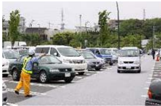
(誘導整理員の配置)