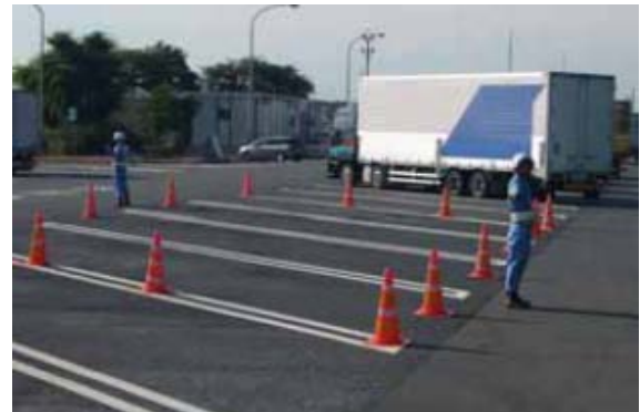
(大型車駐車ますの確保)