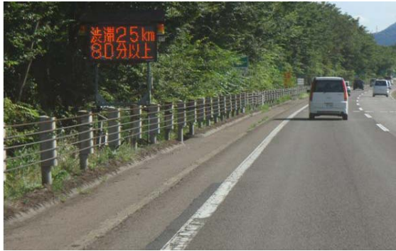
道路(渋滞)状況の表示