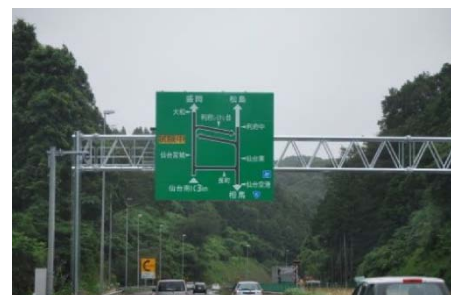
【図形情報板(下り線仙台南IC手前)】