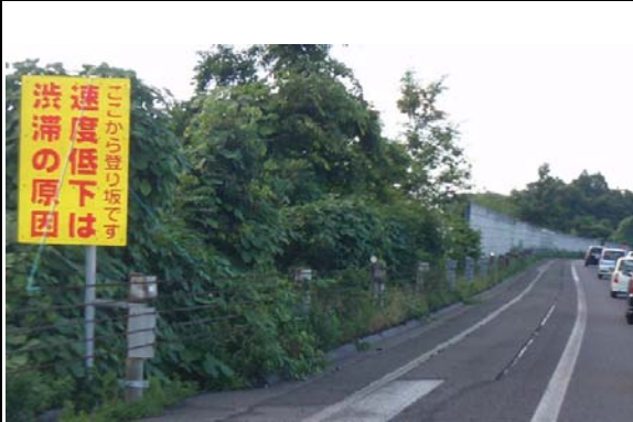
上り坂等での速度低下注意喚起対策