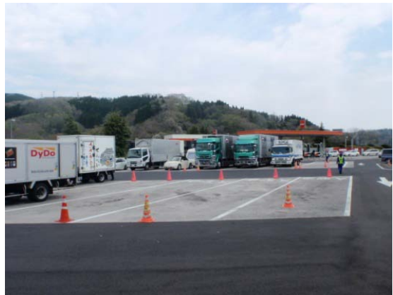
(大型車駐車ますの確保)