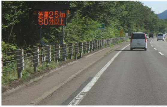
道路(渋滞)状況の表示