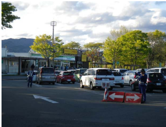
(誘導整理員の配置)