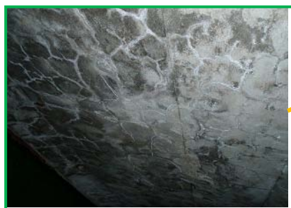
【コンクリート床版裏面ひび割れ状況】