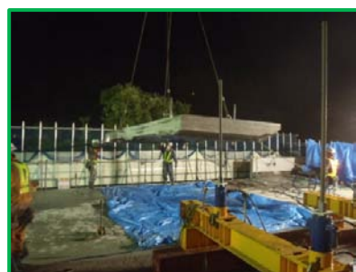
【コンクリート床版の撤去】