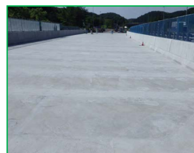
【新設コンクリート床版施工完了】 ※H25.6(綱木川橋上り線)