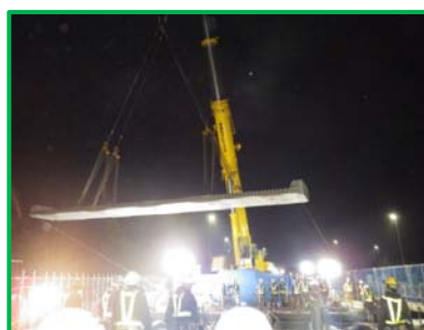
【新設コンクリート床版の設置】