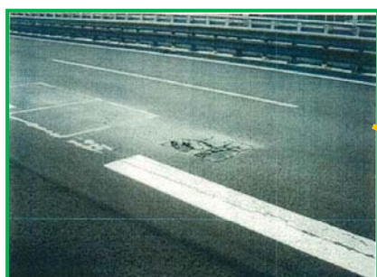
【舗装路面損傷状況】

劣化したコンクリート床版を撤去し、新設のコンクリート床版を設置することにより、走行性・安全性の向上を図ります。