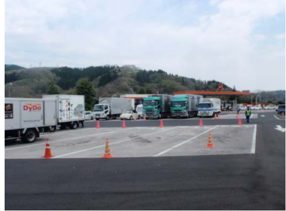
(大型車駐車ますの確保)