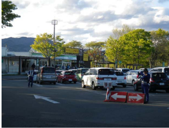
(誘導整理員の配置)