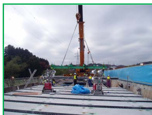
【新設コンクリート床版の設置】