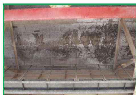
【コンクリート床版裏面ひび割れ状況】