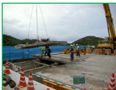
【コンクリート床版の撤去】