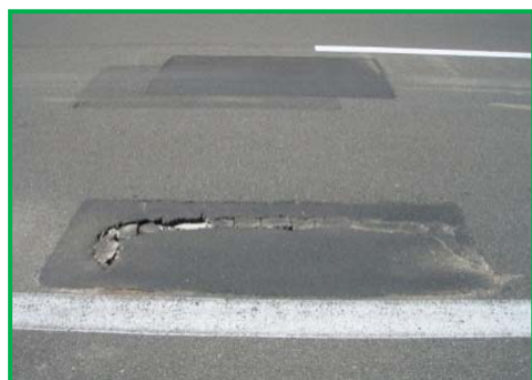
【舗装路面損傷状況】

劣化したコンクリート床版を撤去し、新設のコンクリート床版を設置することにより、走行性・安全性の向上を図ります。