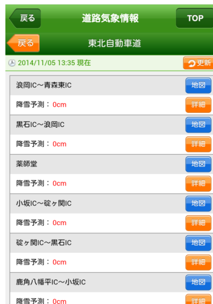
道路気象情報画面