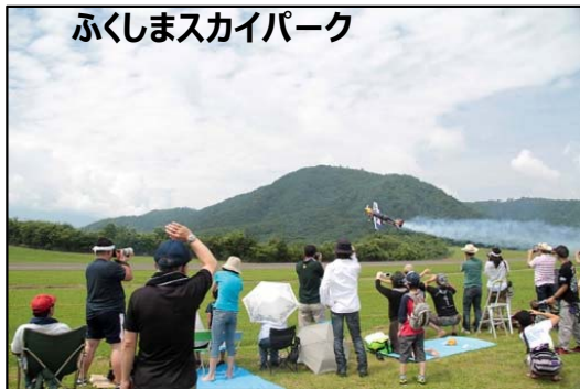
ふくしまスカイパーク