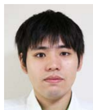
NEXCO東日本 東北支社 郡山管理事務所