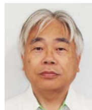
NEXCO東日本 東北支社 鶴岡管理事務所 副所長