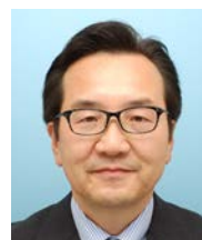
NEXCO東日本 東北支社 いわき管理事務所 副所長 技術士（建設部門）

1952年愛知県生まれ。1976年名古屋工業大学土木工学科卒業。日本道路（株）入社、技術研究所配属1983年～JH長崎自動車道神埼舗装工事。1985年～日本道路技術研究所、現在にいたる。専門分野／コンクリート舗装の技術指導・伝承と調査、診断解析、(一社)セメント協会舗装技術専門委員会委員、元PIARCコンクリート舗装委員会委員