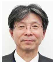
石川工業高等専門学校 環境都市工学科教授 工学博士 技術士（建設部門）