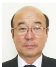
(一社)セメント協会 舗装技術専門委員会委員 技術士（建設部門）