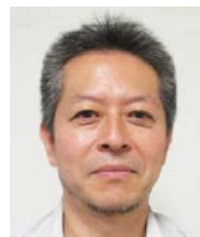
●コーディネーター ㈱高速道路総合技術研究所 舗装研究室長 博士（工学）

1990年東京都生まれ 2015年早稲田大学院創造理工学研究科卒業 2015年東日本高速道路㈱入社郡山管理事務所配属