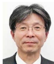
石川工業高等専門学校 環境都市工学科教授 工学博士 技術士（建設部門）