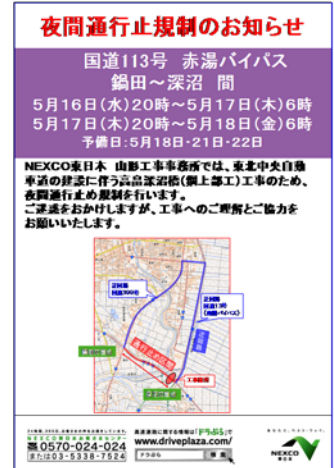
《ポスター・チラシイメージ》