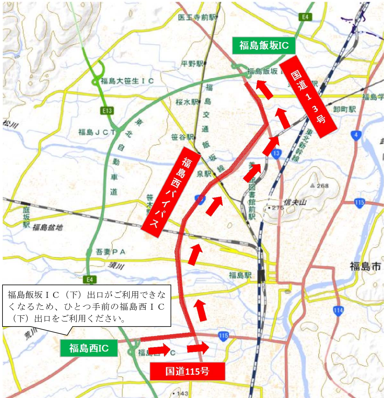
福島飯坂 I C 付近への案内

地理院地図（国土地理院）（ http://maps.gsi.go.jp/ ）をもとに、東日本高速道路㈱が加工