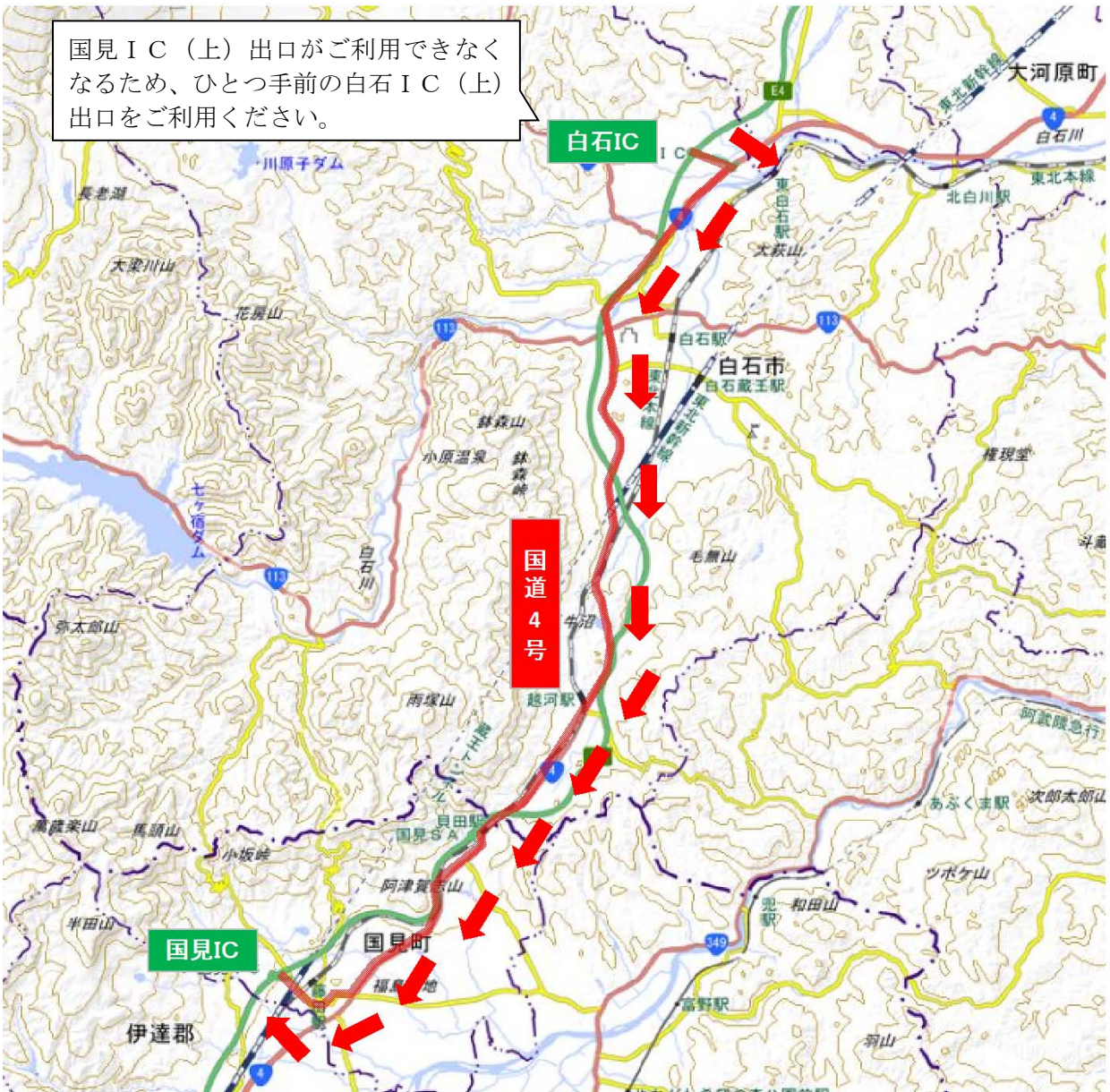
地理院地図（国土地理院）( http://maps.gsi.go.jp/ ) をもとに、東日本高速道路株が加工