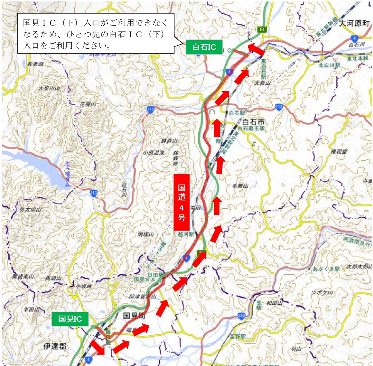
地理院地図（国土地理院）（ http://maps.gsi.go.jp/ ）をもとに、東日本高速道路㈱が加工