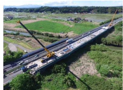
【古い床版撤去状況】