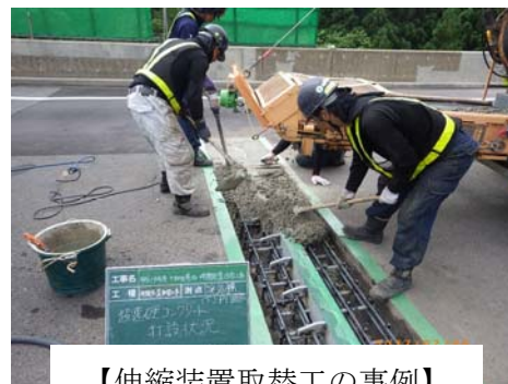
【伸縮装置取替工の事例】