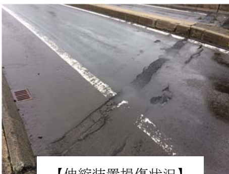
【伸縮装置損傷状況】