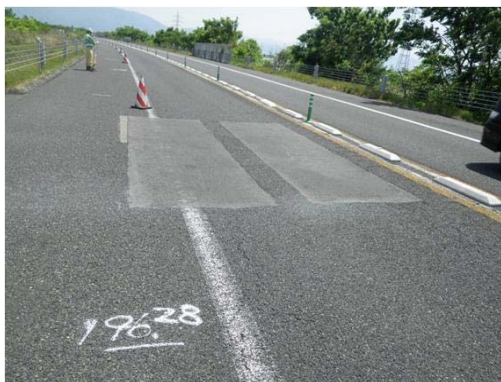
舗装路面の状況(安田IC～三川IC間)

お客さまに安全・快適に高速道路をご利用いただくため、ご理解とご協力をお願いします。