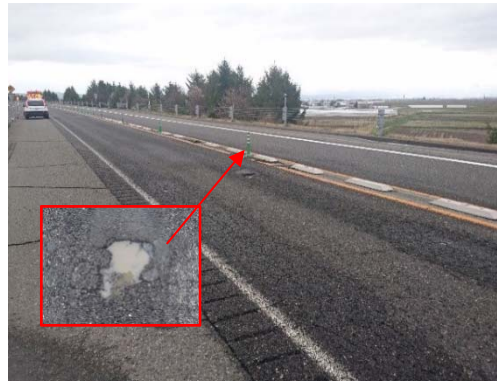
舗装路面の状況(会津坂下IC～会津若松IC間)