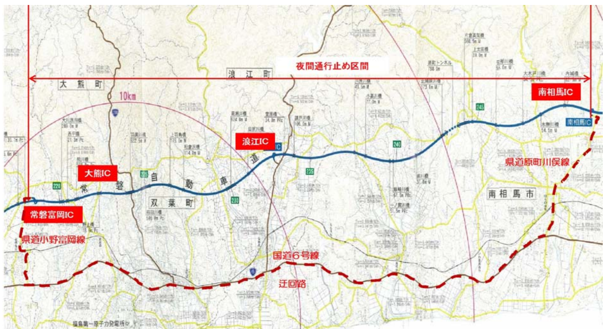
常磐富岡IC～南相馬IC間 通行止め