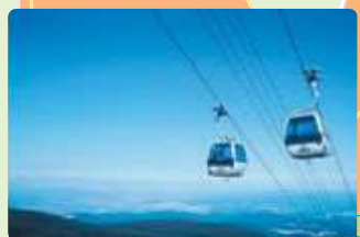
あだたら山ロープウェイ