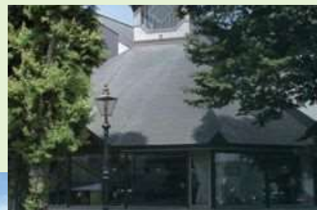
福島市古閑裕而記念館