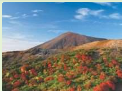
磐梯吾妻スカイライン