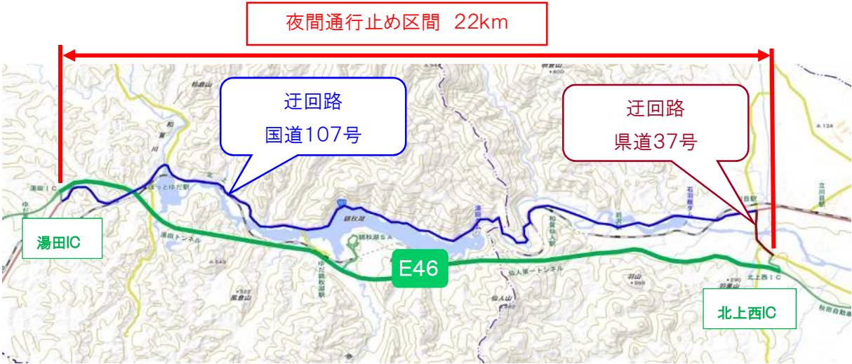
地理院地図(国土地理院)( https://maps.gsi.go.jp/ ) をもとに、東日本高速道路(株)が加工

通常時(高速道路使用) 距離22Km 走行時間約19分 迂回路使用時(国道107号等) 距離27Km 走行時間約36分