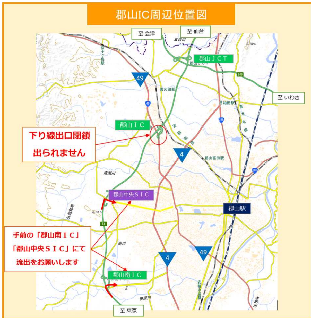
郡山IC(下り線)出口ランプ夜間閉鎖時 位置図

国土地理院地図(国土地理院)( https://maps.gsi.go.jp )