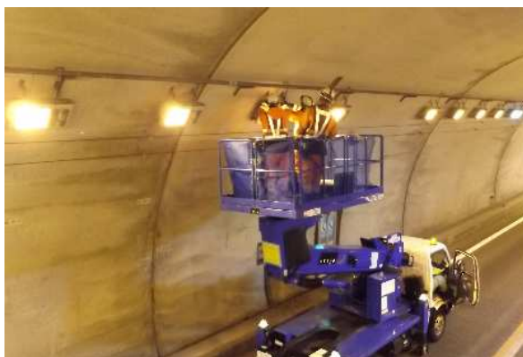
【トンネル内設備点検状況】

安全に走行していただける道路環境を保持するためのトンネル内設備点検を実施します。