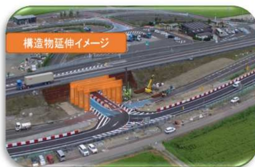
構造物延伸イメージ

常磐道本線の4車線化に伴い、鳥の海PA上り線ランプの構造物を延伸する作業を実施します。