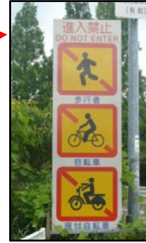
(高速道路入口部に進入禁止看板)