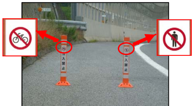
(高速道路出入口部の路肩にポール設置)