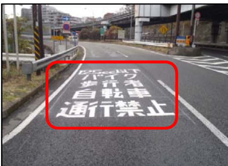
(高速道路入口部に通行禁止の路面標示)