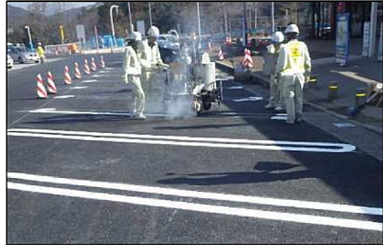
施工状況(イメージ)