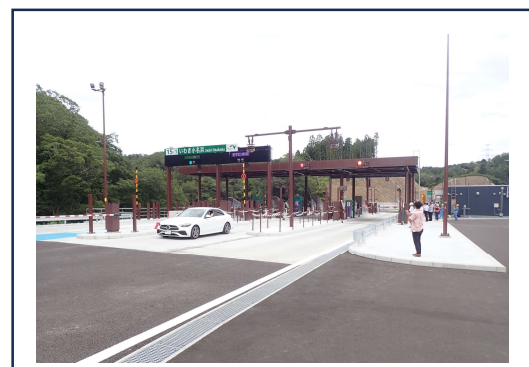
いわき小名浜 IC の開通の瞬間