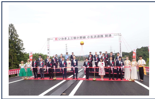
テープカット・くす玉開披

開通式では生憎の雨模様となりましたが、同日 14 時半から執り行われたいわき小名浜 IC 営業開始セレモニーでは晴れ間が見え、15 時に開通を迎えることができました。