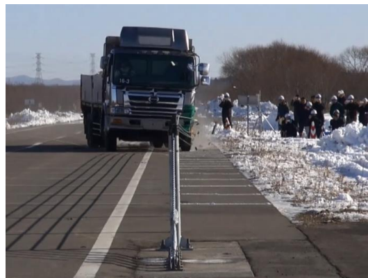
《衝突実験(イメージ)》