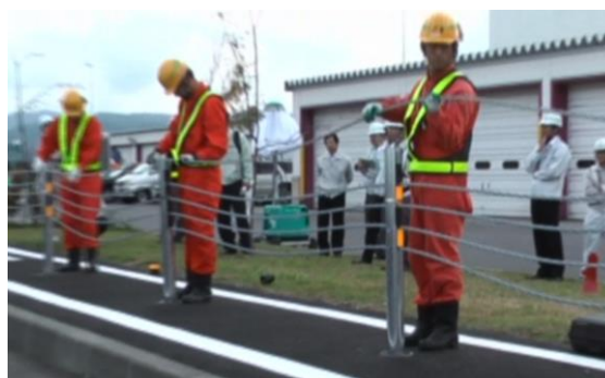
《復旧工事(イメージ)》