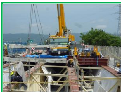
【コンクリート床版の撤去】

《参考》平成27年の春に実施した、「東北自動車道 福島管内橋梁床版補強工事」の施工状況