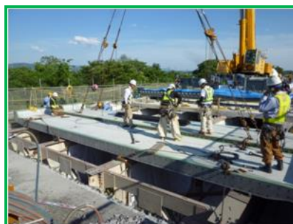
【新設コンクリート床版の設置】