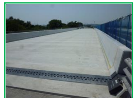
【新設コンクリート床版施工完了】