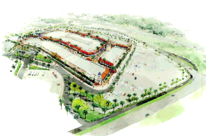
阿見吉原東土地区画整理事業地内の「あみプレミアムアウトレット」の概要