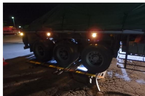
【マットスケールでの重量計量】