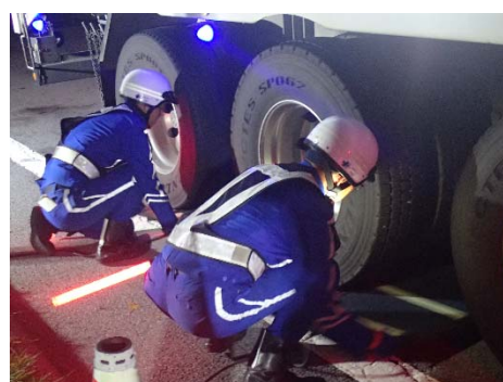
【マットスケールでの重量計量】