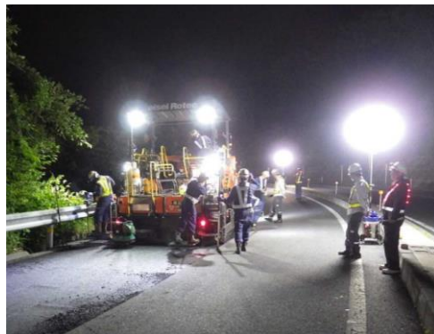
ランプ 舗装補修工事

お客さまに安全・快適に高速道路をご利用いただくため、ご理解とご協力をお願いします。