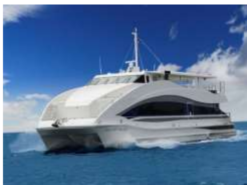
海ほたる PA に接岸し、乗船するクルーザー