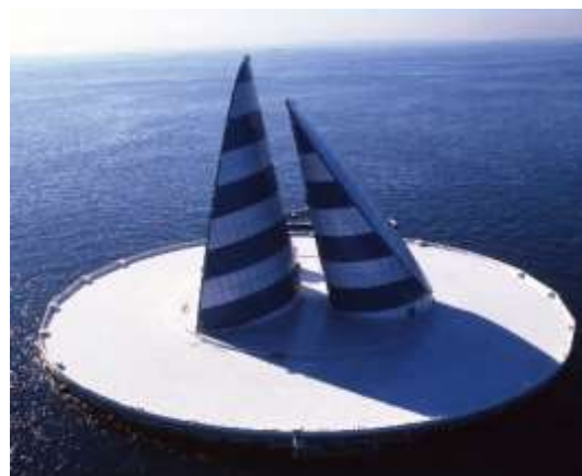
平山郁夫氏・澄川喜一氏が景観設計を手がけた東京湾に浮かぶ「風の塔」に上陸。日頃は立ち入りできない場所です。