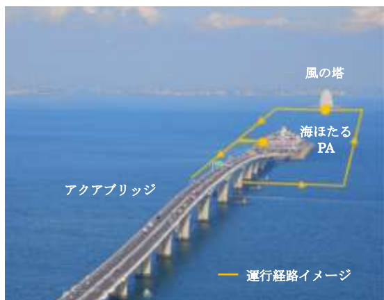
海ほたる PA からクルーザーに乗船し、東京湾の眺望やアクアラインを観覧しながら、「風の塔」へ。

日頃立ち入ることができない、空と海に囲まれた爽快な景色が広がる「風の塔」に上陸できるチャンスは是非ともお見逃しなく！