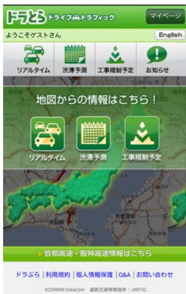
( http://www.driveplaza.com )

※運転中の携帯電話及びスマートフォン等のご使用は禁止されております。ご利用の際は、ご出発前やご休憩時、または同乗者の方による操作をお願いします。