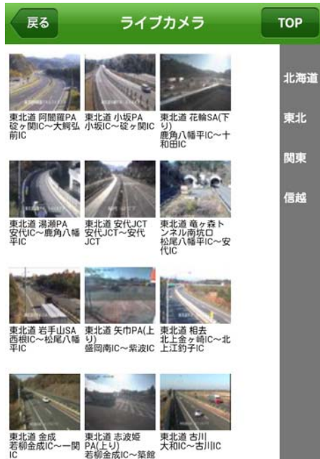
ライブカメラ画面(イメージ)