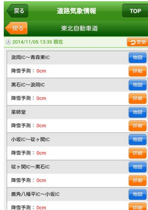
道路気象情報画面(イメージ)