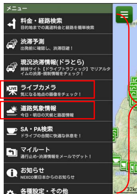
メニュー画面(イメージ)

(詳細はこちら: http://www.driveplaza.com/dorapura_app/ )