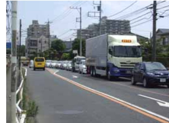
神奈川県平塚市(国道1号 産業道路交差点付近)