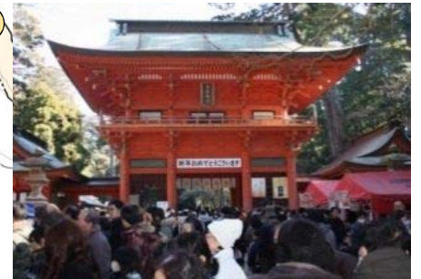
※H29年の初詣(1/1～1/3)3日間の 参拝者は約70万人