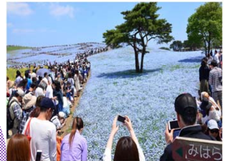
※H29年のGW(4/29～5/7)9日間の 入園者数は約58万人