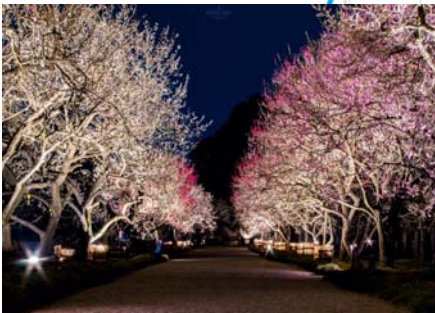
※H29年水戸の梅まつり(2/20～3/31) 来場者は約49万人